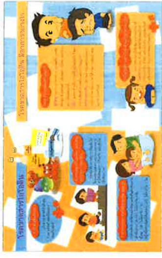
รูป 4. หน้าที่ของไอโอดีนในประชากรชาย